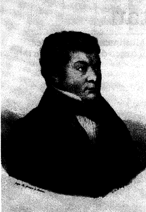
«Volksbildung ist Volksbefreiung»: Zschokke.

Die Argumente für mehr Freiheit, Eigeninitiative und Wettbewerb in den Schulen sind vernünftig und bedenkenswert – dennoch haben es die Anhänger einer freien Schulwahl in der Schweiz nach wie vor schwer, sich Gehör zu verschaffen. Eine breite und offen geführte Diskussion findet nicht statt.